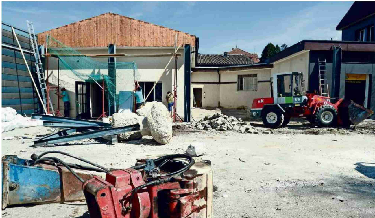
Bauschutt und schwere Maschinen: In Aadorf wird der Coop saniert, ausgebaut und modernisiert.